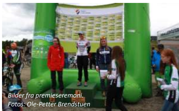
Bilder fra premieseremoni.